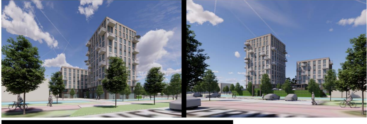
Schetsen van de woningbouwplannen voor de Poldermolen te Papendrecht.