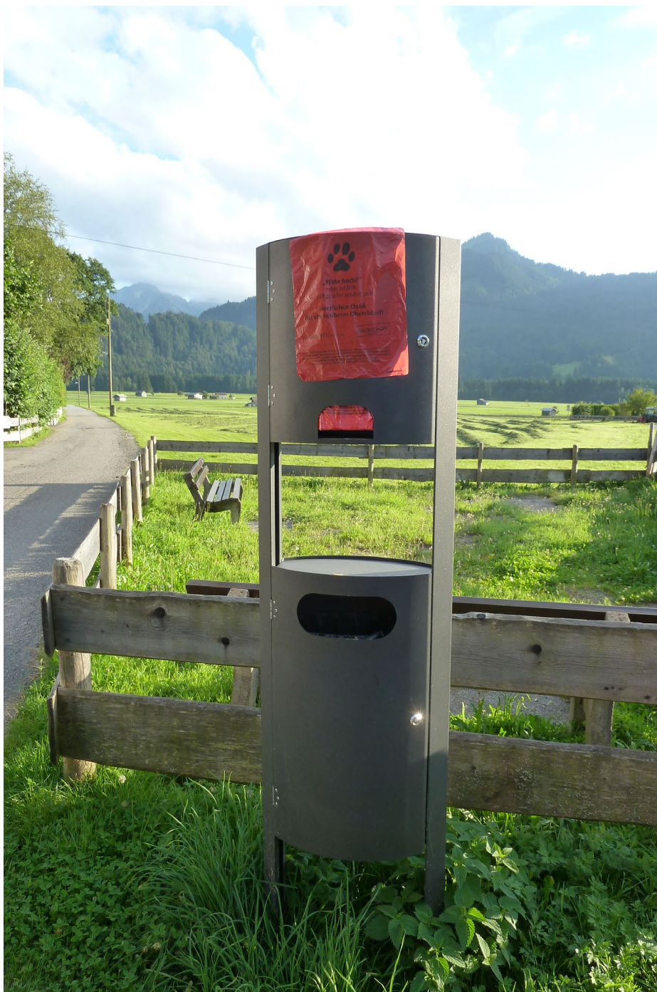
Figuur 1 de speciale hondenuitwerpselen afvalbak

Voorlopig is de hondenbelasting, contrair aan de belofte uit het Coalitieakkoord van 2014, nog niet afgeschaft, dus de hondenbezitters betalen nog steeds een forse hondenbelasting. Dat zou mogelijk kunnen rechtvaardigen dat wij het als gemeente de hondenbezitters in onze gemeente iets meer naar de zin kunnen gaan maken en hen helpen de uitwerpselen van hun beestje op te ruimen. Zoals het hoort, zodat er van de spreekwoordelijk ervaren overlast minder over blijft. Uiteindelijk wordt iedereen hier dan weer een beetje beter van. Dan ziet u hieronder wat wij bedoelen met een manier van het ondersteunen dan wel faciliteren van het opruimen van hondenpoep door hondenbezitters.