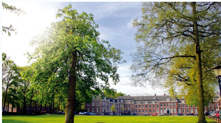
Hoofdkantoor; Zusterplein 22 - Zeist