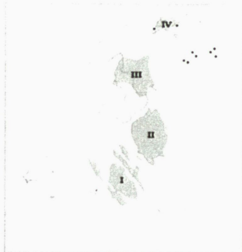
T&A Survey 2011, zoutkoepels toegevoegd WISE. Boomse Klei min. 500m diep en min. 100m dik

Eindberging is de term die gebruikt wordt voor het definitief (ondergronds) opslaan van radioactief afval. Dit moet op zo'n manier gebeuren dat het afval buiten bereik blijft van de mens en niet kan lekken in het milieu. Het hoogradioactieve afval uit kerncentrale Borssele blijft 100.000-jaren gevaarlijk voor mens en milieu. Het wordt tijdelijk opgeslagen in de COVRA in Zeeland. Daar wordt ook middel- en laagradioactief afval opgeslagen afkomstig van de kerncentrale, ziekenhuizen, de industrie en het bedrijfsleven. De volumes van dit kernafval zijn fors, de radioactieve levensduur varieert van een paar dagen tot een paar honderd jaar.