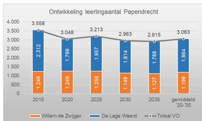
Figuur 1: Ontwikkeling leerlingaantal 2015-2035

Voor het berekenen van de ruimtebehoefte voor het haalbaarheidsonderzoek moet een keuze gemaakt worden van welk leerlingenaantal uitgegaan wordt. Het gemiddeld aantal leerlingen in de komende 15 jaar komt nagenoeg overeen met het huidig aantal leerlingen. De verhouding tussen het aantal leerlingen van beide scholen fluctueert, maar laat zich ook lastig voorspellen. In onderstaande tabel is de verhouding tussen beide scholen per 5 jaar in de periode 2015-2035, en het gemiddelde van de periode 2020-2035 weergegeven.