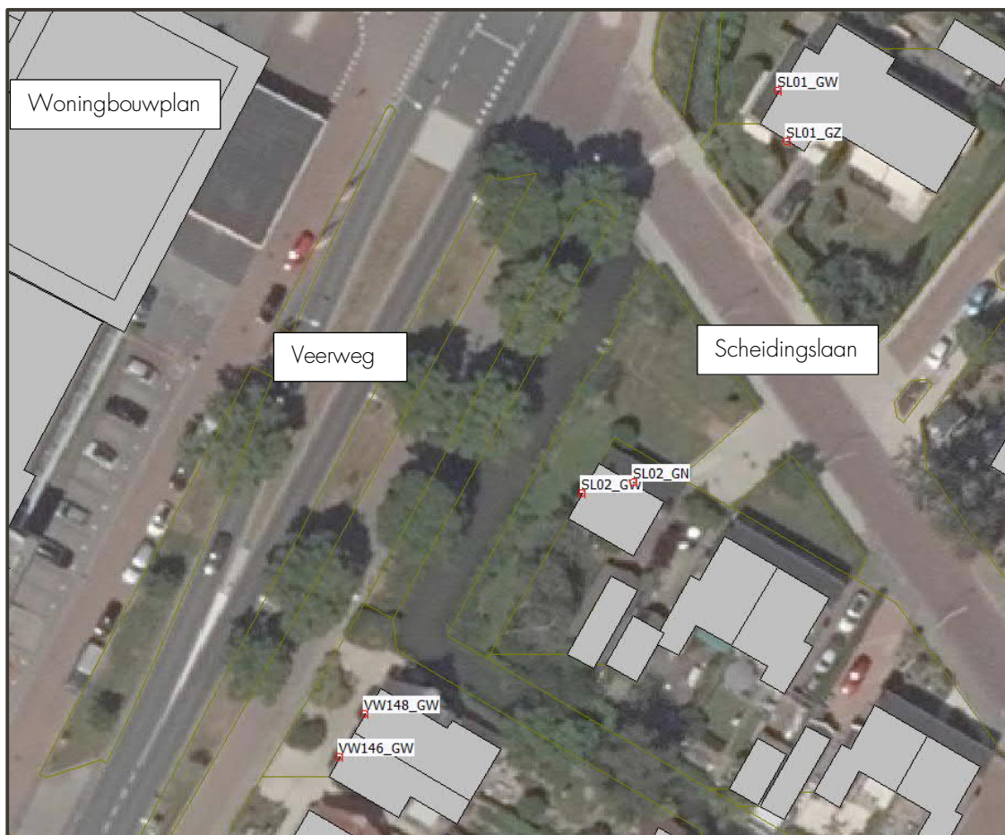
Figuur 2: Ligging rekenpunten, wegen en woningbouwplan

In de onderstaande figuur is de ligging van de toetspunten, de wegen en het woningbouwplan weergegeven.