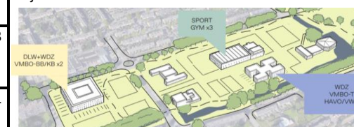
Van de Palmpad