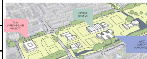
Van de Palmpad