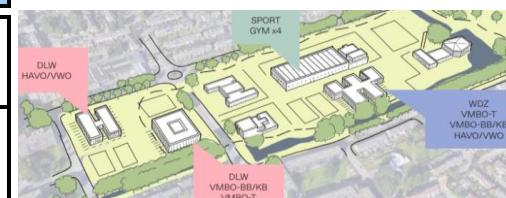
Van de Palmpad