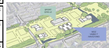
Van de Palmpad