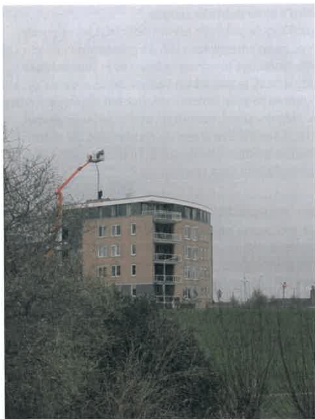
Figuur 1 plaatsing 5G zendmast Westeind

Er is iets aan de hand: we krijgen steeds meer informatie die tot het inzicht leidt dat de Nederlandse Staat onrechtmatig handelt omdat zij burgers niet beschermt tegen de gevaarlijke gevolgen van blootstelling aan elektromagnetische velden van 5G. Deze verplichting ligt vast in de wet. De overheid slaat alle waarschuwingen in de wind. De afgelopen jaren is meer bewustzijn over de schadelijke gevolgen van Elektromagnetische Velden (EMV) ontstaan, die schade toebrengt aan mens, dier en leefmilieu.